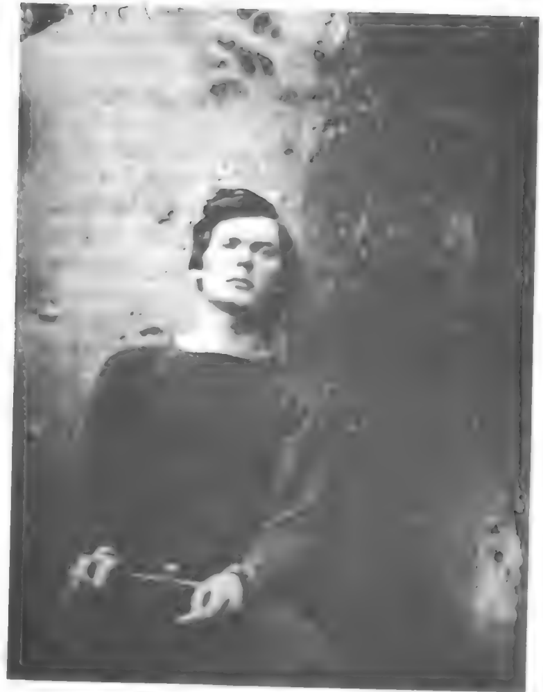
"Ele está morto e vai morrer."

Esse punctum , mais ou menos apagado sob a abundância e a disparidade das fotos de atualidade, pode ser lido abertamente na fotografia histórica: nela há sempre um esmagamento do Tempo: isso está morto e isso vai morrer. Essas duas garotas que olham um aeroplano primitivo sobre sua aldeia (estão vestidas como minha mãe criança, brincam de arco), como estão vivas! Têm toda a vida diante delas; mas também estão mortas (hoje), elas portanto já estão