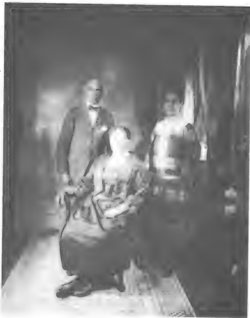
Os sapatos com presilhas.

James van der Zee: Retrato de família, 1926.