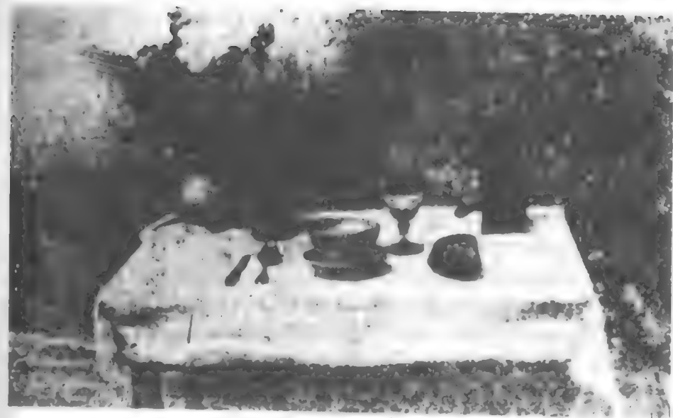
A primeira foto.