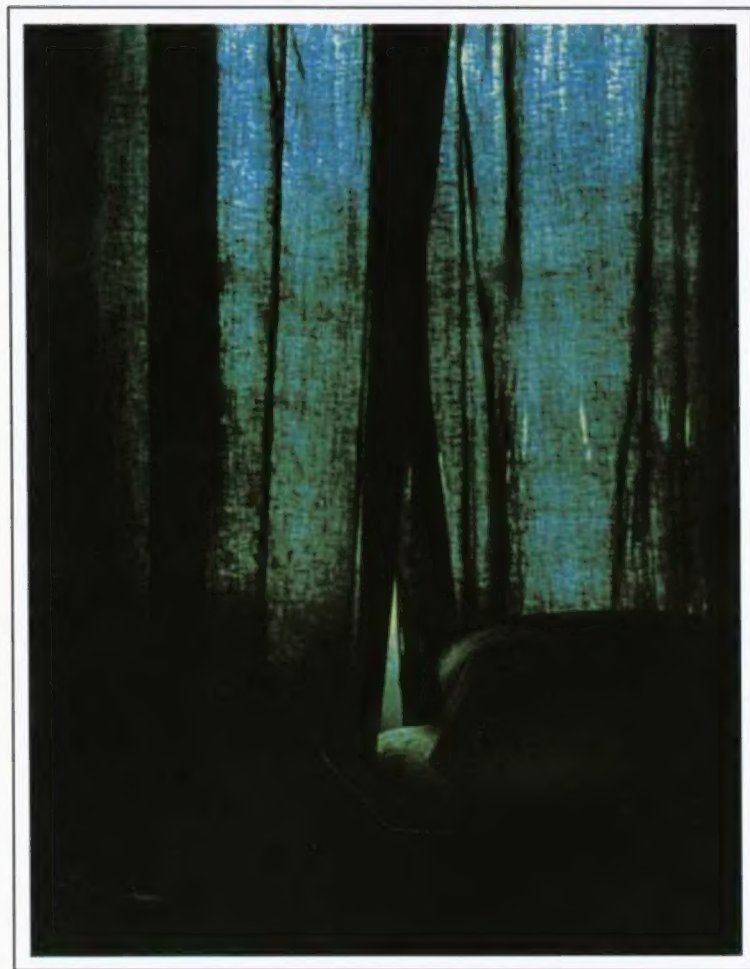
Daniel Boudinet: Polaroid , 1979.