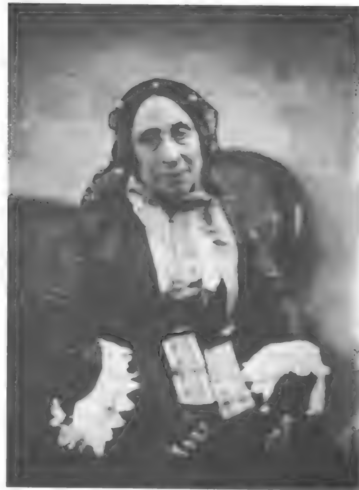
“Marceline Desbordes-Valmore reproduz em seu rosto a bondade um pouco simplória de seus versos.”

lineamentos da verdade. É o que acontece quando julgo tal foto “parecida”. No entanto, ao refletir sobre isso, sou obrigado a me perguntar: quem parece com quem? A semelhança é uma conformidade, mas a quê? a uma identidade. Ora, essa identidade é imprecisa, imaginária mesmo, a ponto de eu poder continuar a falar de “semelhança”, sem jamais ter visto o modelo. Isso é o que ocorre com a maioria dos retratos de Nadar (ou, hoje, de Avdon): Guizot é “parecido”, porque está conforme a seu mito de homem austero; Dumas, dilatado, expansivo, porque conheço sua suficiência e sua fecundidade; Offenbach, porque sei que sua música tem algo de espirituoso (dizem); Rossini parece falso, malévolo (parece, portanto está parecido); Marceline Desbordes-Valmore reproduz em seu rosto a bondade um pouco simplória de seus versos; Kropotkine tem os olhos claros do idealismo anarquizante, etc. Vejo-os todos, posso espontaneamente dizer que são “parecidos”, já que estão conformes ao que espero deles. Prova a contrario : eu, que me sinto um sujeito incerto, amítico, como poderia eu me achar parecido? Pareço