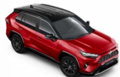
2SC Červená – karmínová se střechou v černé barvě speciální lak, dostupný pouze pro verzi GR SPORT bez příplatku

Pro výbavu Adventure není možné jednobarevné lakování kombinovat s pakem Skyview.