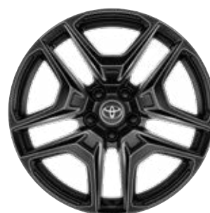
19" kola z lehké slitiny, pneumatiky 235/55 R19 Pro výbavu GR SPORT