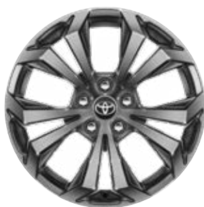
18" kola z lehké slitiny, pneumatiky 225/60 R18 Pro paket Style