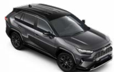
2QZ Šedá – popelavá se střechou v černé barvě metalický lak, dostupný pouze pro verze Selection a GR SPORT bez příplatku