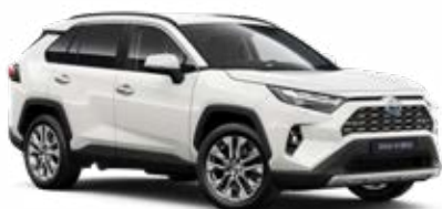
040 Bílá – čistá standardní lak, dostupný pro verze Comfort a Executive bez příplatku