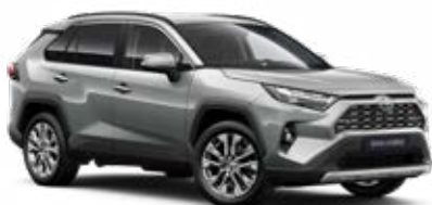
1D6 Stříbrná – zirkonová metalický lak, dostupný pro verze Comfort a Executive 15 000 Kč