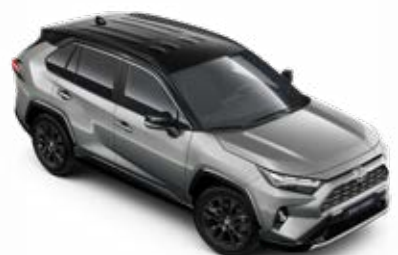
2QY Stříbrná – zirkonová se střechou v černé barvě metalický lak, dostupný pouze pro verze Selection a GR SPORT bez příplatku