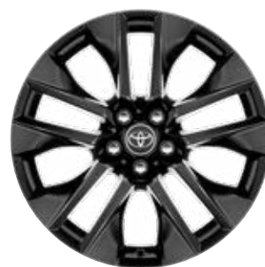
19" kola z lehké slitiny v černém designu, pneumatiky 235/55 R19 Pro výbavu Selection