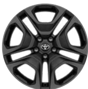
19" kola z lehké slitiny, pneumatiky 235/55 R19 Pro výbavu Adventure