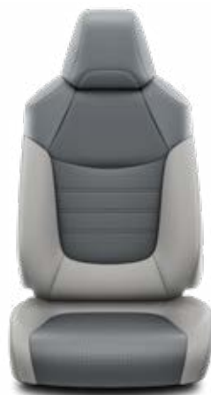
LA10 Kombinace přírodní a syntetická kůže šedé Pro výbavu Executive