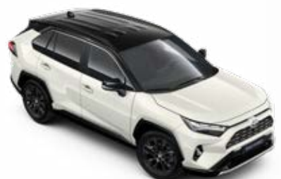
2PS Bílá – perleťová se střechou v černé barvě perleťový lak, dostupný pouze pro verze Selection a GR SPORT bez příplatku