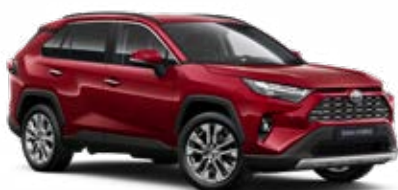
3T3 Červená – rubínová speciální lak, dostupný pro verze Comfort a Executive 22 500 Kč, pro výbavu Adventure bez příplatku