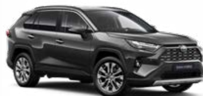
1G3 Šedá – popelavá metalický lak, dostupný pro verze Comfort a Executive 15 000 Kč, pro výbavu Adventure bez příplatku