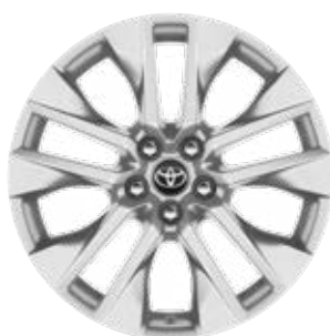
19" kola z lehké slitiny, pneumatiky 235/55 R19 Pro výbavu Executive