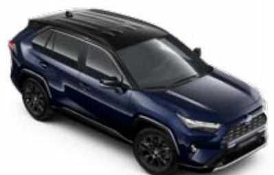
2RA Modrá – tmná se střechou v černé barvě metalický lak, dostupný pouze pro verze Selection a GR SPORT bez příplatku