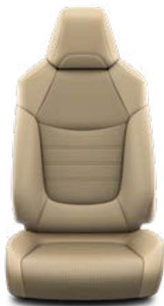
LA40 Kombinace přírodní a syntetická kůže béžové Pro výbavu Executive