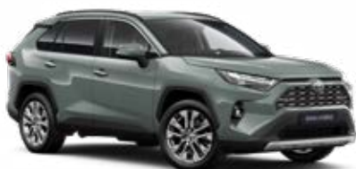
6X3 Zelená – Urban standardní lak, dostupný pro verze Comfort a Executive 15 000 Kč, pro výbavu Adventure bez příplatku