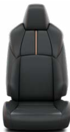
EB20 Syntetická kůže v designu Adventure Pro výbavu Adventure