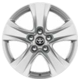
17" kola z lehké slitiny, pneumatiky 225/65 R17 Pro výbavu Comfort