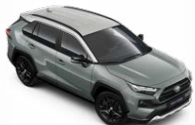
2QU Zelená – Urban se střechou v barvě stříbrná popelavá standardní lak, dostupný pouze pro verzi Adventure bez příplatku