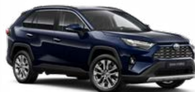
8X8 Modrá – tmná metalický lak, dostupný pro verze Comfort a Executive 15 000 Kč