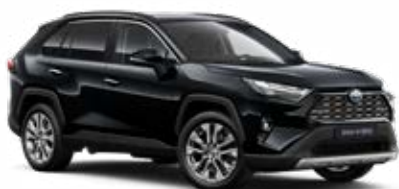
218 Černá – klasická metalický lak, dostupný pro verze Comfort a Executive 15 000 Kč, pro výbavu Adventure bez příplatku