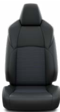
EC20 Syntetická kůže/textilie v designu Selection Pro výbavu Selection