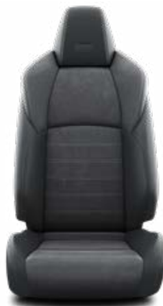
EF20 Černá Alcantara v designu GR SPORT Pro výbavu GR SPORT