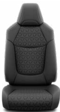
FA20 Textilní černé Pro výbavu Comfort