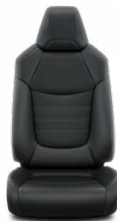
LA20 Kombinace přírodní a syntetická kůže černé Pro výbavu Executive