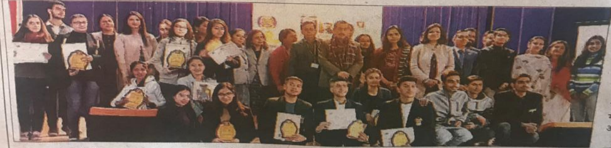
शिमला : संजौली कॉलेज में विज्ञान प्रतियोगिता के विजेता संयुक्त चित्र में।