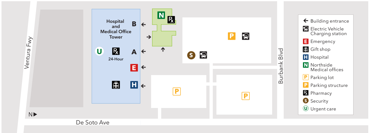
Map not to scale