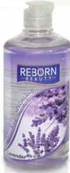
Lavender Massage Oil زيت للتدليك بخلصة اللافندر