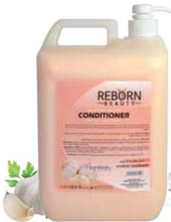
Hair Conditioner with Garlic Extracts