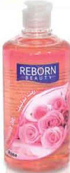
Rose Massage Oil زيت للتدليك بخلصة الورد