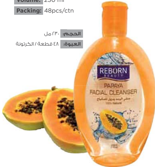
Papaya Facial Cleanser

الحجم: ٢٣٠ مل العبوة: ٤٨ قطعة / الكرتونة