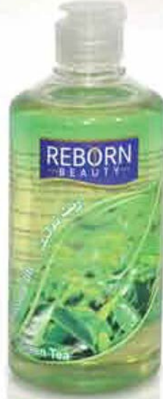
Green Tea Massage Oil زيت تدليك بخلصة الشاي الاخضر