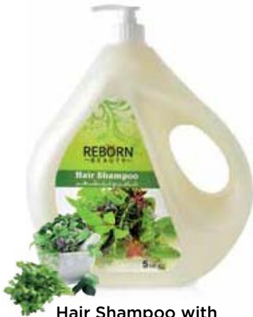
Hair Shampoo with Herbal Extracts