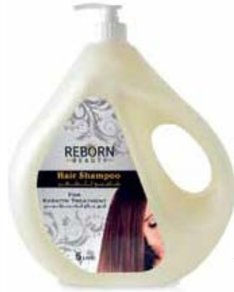
Hair Shampoo with Keratin