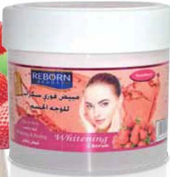
Strawberry Whitening Scrub