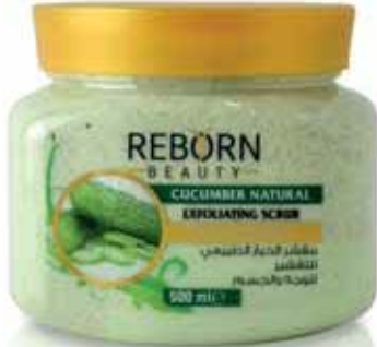
Cucumber Natural Scrub كريم سنفرة لتفتيح البشرة بخلاصة الخيار

Lightweight and non-greasy, the gentle formulation exfoliates without damaging or irritating the skin and leaves the skin instantly brighter, soft and refined. Walnut Husks combined with the anti-ageing and nourishing properties of Vitamin E, protect and nourish the skin whilst offering a deep, purifying cleanse.