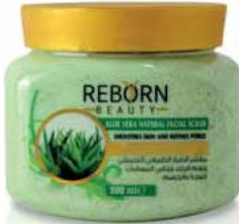
Aloe Vera Natural Facial Scrub كريم سنفرة لتفتيح البشرة بخلاصة الصبار