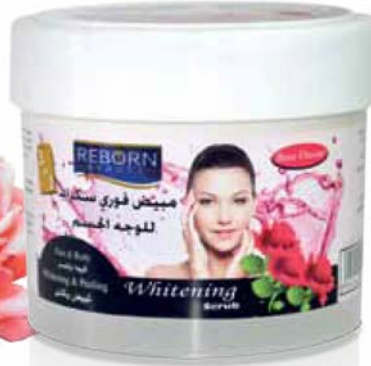
Rose Whitening Scrub