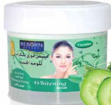
Cucumber Whitening Scrub