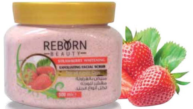
Strawberry Whitening Scrub