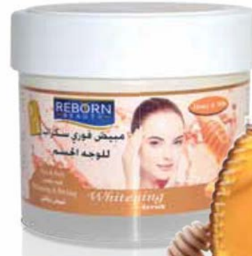
Honey & Milk Whitening Scrub

كريم تقشير مبيض لللبشرة بخلاصة العسل و الحليب