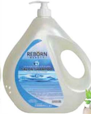
Salon Shampoo for All Hair Types