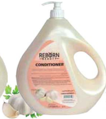
Hair Conditioner with Garlic Extracts