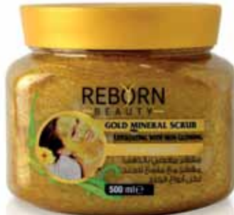
Gold Mineral Scrub كريم سنفرة لتفتيح البشرة بخلاصة معدن الذهب