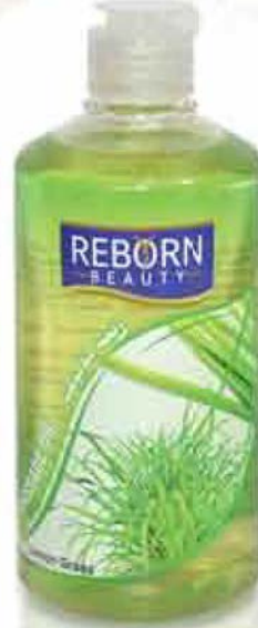
Lemon Grass Massage Oil زيت تدليك بخلصة عشب الليمون