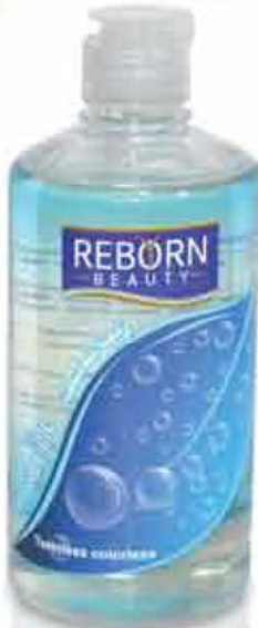
Tasteless Colorless Massage Oil زيت تدليك بدون رائحة و بدون طعم