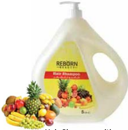
Hair Shampoo with Mix Fruits Extracts

ريون بيوتي يقدم شامبو للشعر بمثابة العلاج المثالي للشعر. شامبو للإستخدام المهني ينظف و يقوي الشعر و يجعله صحيا و لامعا و هو مناسب لجميع أنواع الشعر. إستعملي هذا الشامبو لتزيتب الشعر و العديد من منتجات صالونات التجميل التي تمنحك شعرا ذو مظهرا صحيا و جميلا.