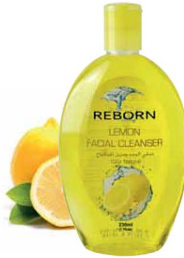
Lemon Facial Cleanser

منقي الوجه و مزيل للمكياج بخلاصة البابايا