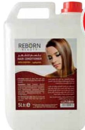
Hair Conditioner with Keratin