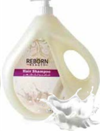
Hair Shampoo with Milk