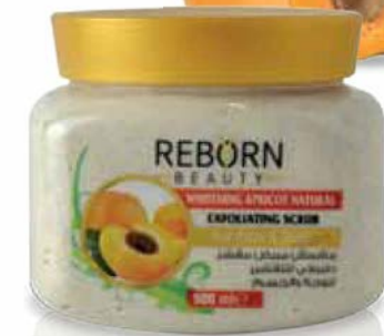
Whitening Apricot Natural Scrub كريم سنفرة لتفتيح البشرة بخلاصة المشمش