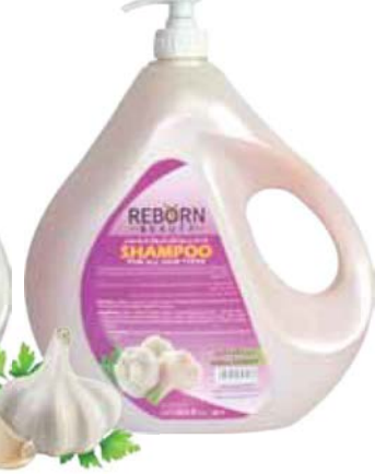
Hair Shampoo with Garlic Extracts