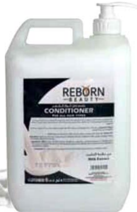
Hair Conditioner with Milk