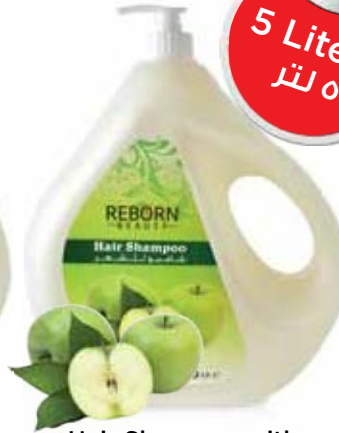
Hair Shampoo with Green Apple Extracts