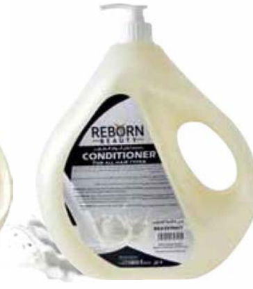
Hair Conditioner with Milk