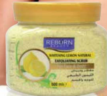
Whitening Lemon Natural Scrub كريم سنفرة لتفتيح البشرة بخلاصة الليمون