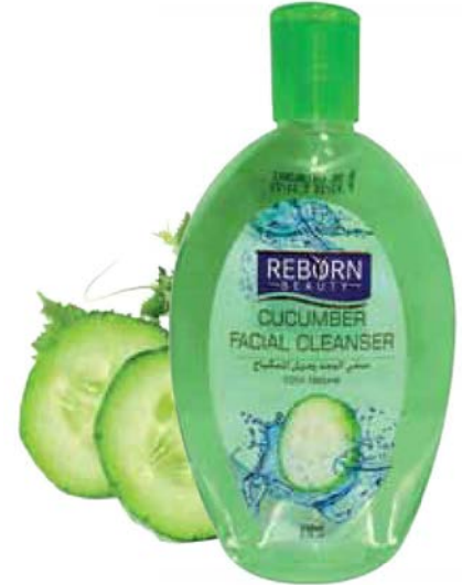
Cucumber Facial Cleanser

منقي الوجه و مزيل للمكياج بخلاصة الليمون