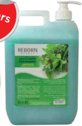
Hair Shampoo with Herbal Extracts