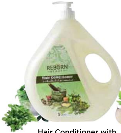
Hair Conditioner with Herbal Extracts

يعمل البلسم على ترطيب و مرونة الشعر سواء كان مموجا أو كثيفا كذلك لو كان حريريا أو مصبوغا. يساعد على إستعادة نعومة الشعر و قوته. يمكنك ترك البلسم على الشعر لمدة طويلة. مناسب لجميع أنواع الشعر.