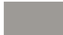
SW 7673 Pewter Cast